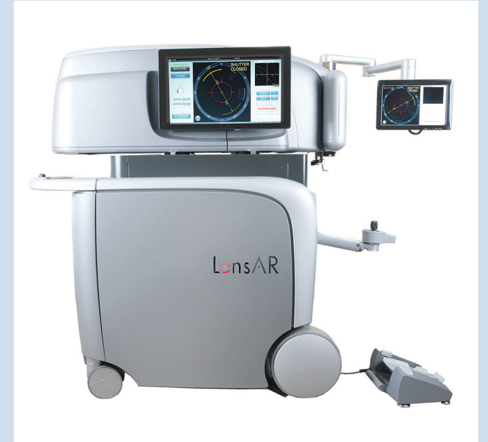
Der „LensAR“ ist ein Femtosekundenlaser der allerneuesten Generation.

Augenklinik Bellevue Lindentallee 21-23 24105 Kiel Tel.: 0431-30108-40 www.augenklinik-bellevue.de