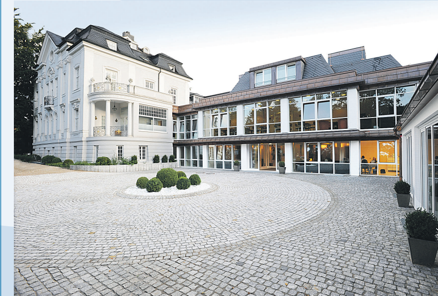
Die Augenklinik Bellevue

Ob Mono- oder Multifokallinse, ob Kataraktoperation oder Korrektur von Alterssichtigkeit – alternativ zur bewährten Operationstechnik steht eine neue Technologie zur Verfügung: das LensAR-System, ein Femtosekundenlaser der allerneuesten Generation. Mit dieser Innovation wird das Skalpell des Operateurs überflüssig und der Eingriff kann noch sicherer, noch präziser, noch einfacher und damit noch komplikationsärmer durchgeführt werden. Das Verfahren verbessert alle Linsenimplantationen und ermöglicht gleichzeitig eine Korrektur eventuell vorhandener Hornhautverkrümmungen in bislang ungekannter Qualität.